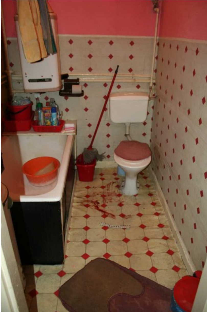
Ujawnianie śladów krwi nie powinno sprawiać

narzędzie przestępstwa - domniemane narzędzie przestępstwa należy przesłać do badań w takiej postaci, w jakiej zostało ujawnione.